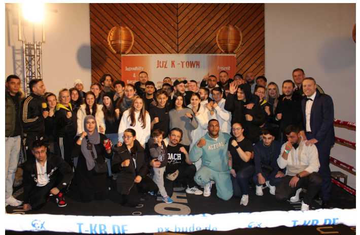
Der Box Gym des JUZ k.town