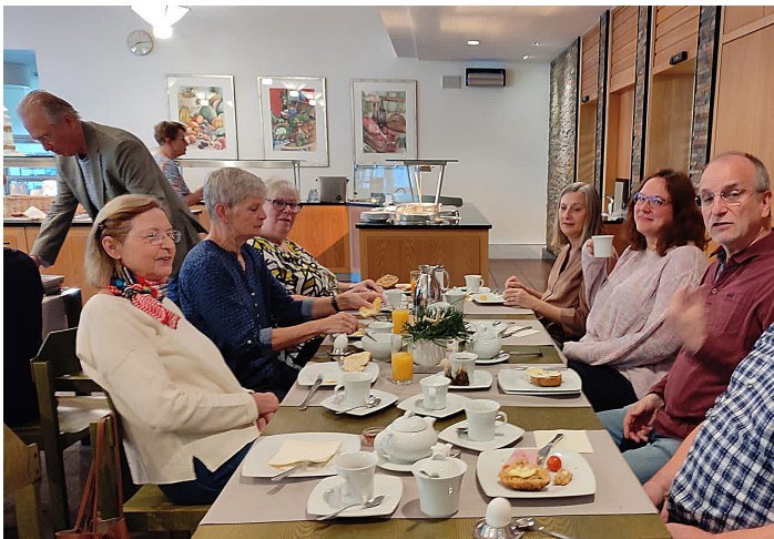
Der Kirchenvorstand beim gemeinsamen Frühstück

Am letzten Wochenende im September nahm sich der Kirchenvorstand unserer Gemeinde die Zeit, zwei Tage lang über aktuellen Herausforderungen und die Zukunft der Kirche vor Ort und in Hanau nachzudenken. Dort trafen wir auf die anderen Hanauer Kirchenvorstände von der Stadtkirchengemeinde und der Kirche am Limes.