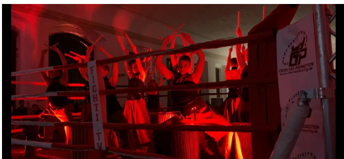
Atemberaubende Atmosphäre beim Auftritt des Ballettensembles Bladin aus Hanau