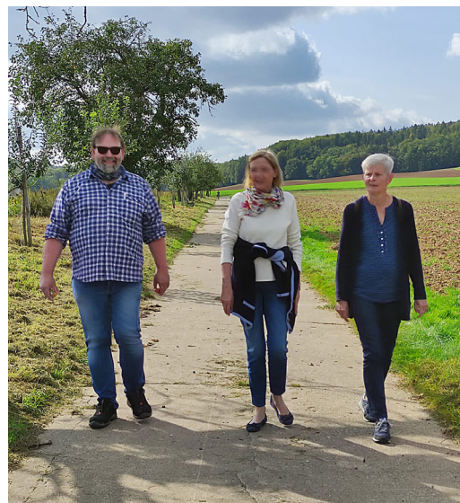
Da kommen die besten Ideen

Richtig viel Zeit miteinander zu haben und auch gemeinsam zu essen und die Abende zu verbringen war ein guter Rahmen für die inhaltlich schweren Themen.