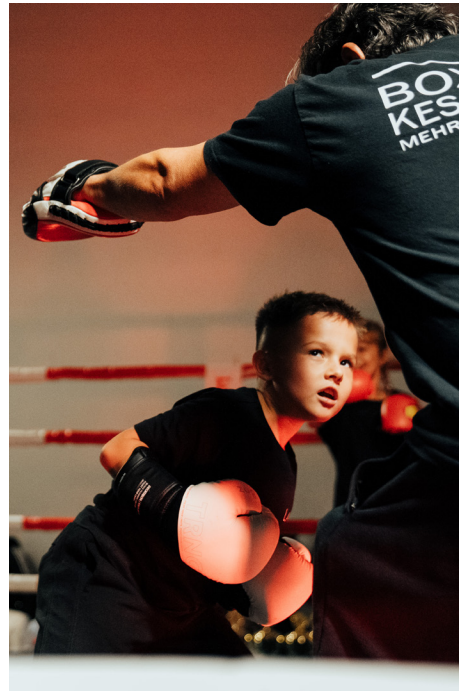
Trainingsdemonstration der Kleinsten