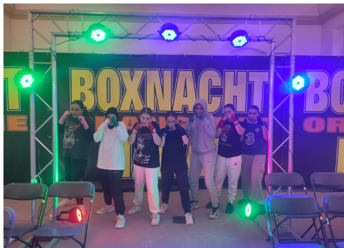
Box-Mädels trainieren für den Auftritt