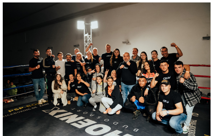
Box Gym nach einer erfolgreichen Veranstaltung