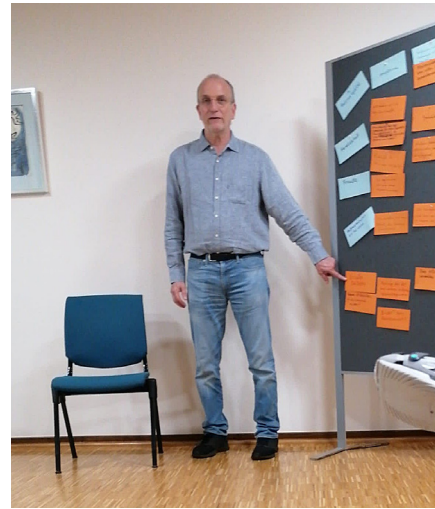
So viele Themen!

Auch wurde über die Zukunft unserer immer kleiner werdenden Gemeinde nachgedacht. Was wird sein, wenn Pfarrer Rabenau in ein paar Jahren in den Ruhestand geht? Welche Auswirkungen wird das für uns haben? Wird die Pfarrstelle wieder besetzt? Wie wird Gemeindegemeinschaft in einigen Jahren dann aussehen?